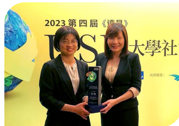
兒家研究中心 獲112年遠見USR「人才共學組」首獎