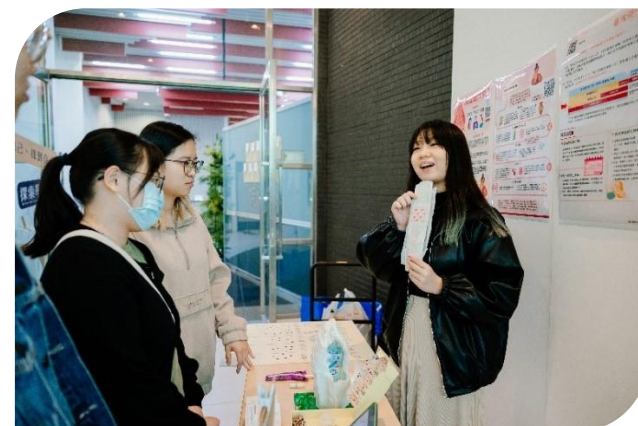
「月經：理論、思潮與行動」課程 獲114年遠見USR「永續課程組」楷模獎