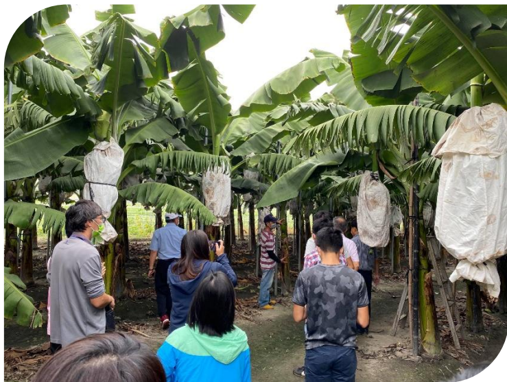
113年台灣永續行動獎 SDG 4 金獎 114年遠見USR「產業共創組」楷模獎

生農學院團隊秉持「學術下鄉」精神，長期深耕雲林，成立「 植物教學醫院 」及「 動物醫院診斷中心 」，每年提供在地多場 諮詢講習 以及近萬件的 動植物醫學診斷服務 ；並協助 產品增值 ，致力打造從產地到餐桌的完整產業鏈輔導體系。